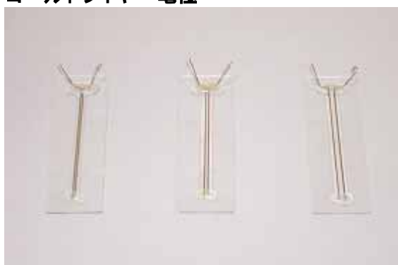
CUY500G0.5 CUY500G1 CUY500G2