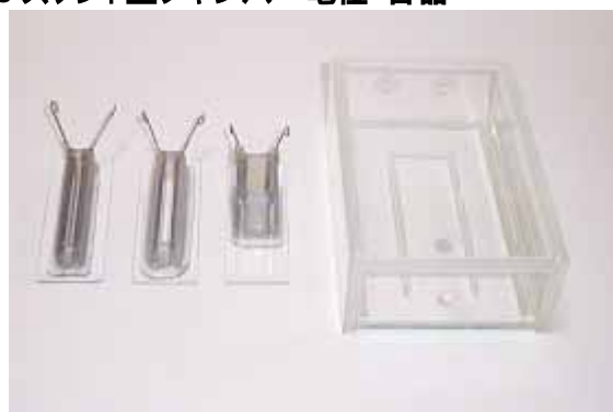
CUY498-3 CUY498-4 CUY498-10 CUY499