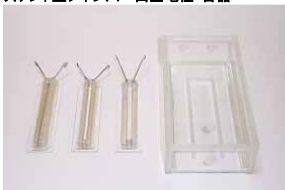
CUY497P2 CUY497P3 CUY497P4 CUY499L