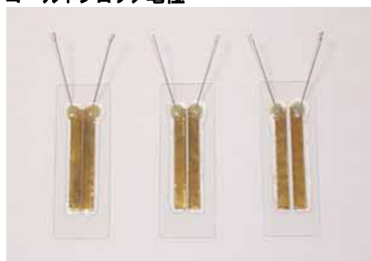
CUY501G0.5L CUY501G1L CUY501G2L